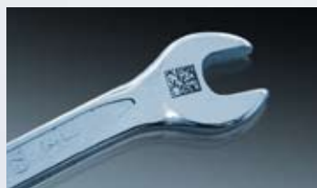
Laserbeschriftung eines DataMatrix Codes.