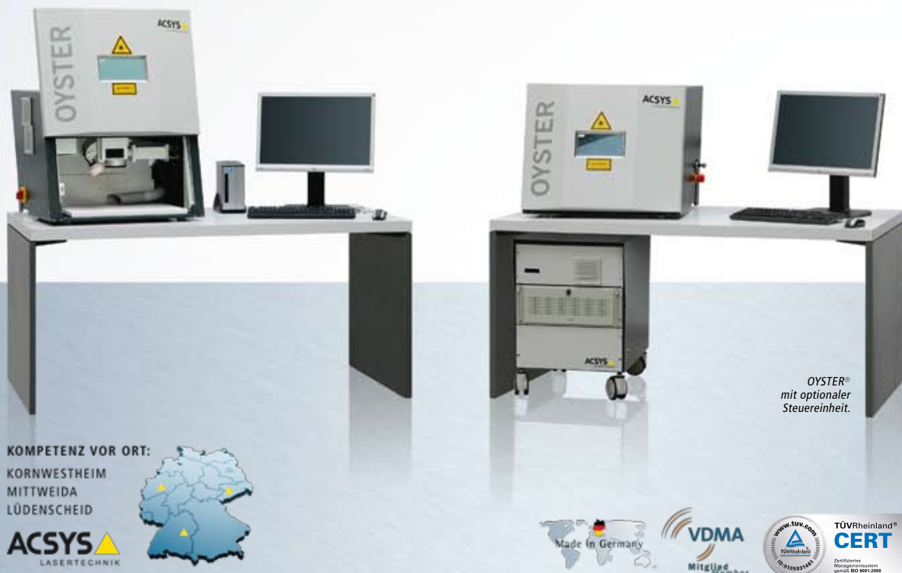
OYSTER® mit optionaler Steuereinheit.

Langlebige Laserquellen und eine gute Zugänglichkeit reduzieren den Wartungs- und Serviceaufwand auf ein Minimum. Kürzeste Reaktionszeiten rund um die Uhr und eine qualifizierte Online-Unterstützung mit modernsten Diagnosesystemen sichern die Anlagenverfügbarkeit. Darüber hinaus hält unser Ersatz- und Verschleißteilcenter ein breites Sortiment direkt ab Lager bereit.