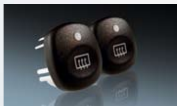
Tag- Nacht design in der Automobilbranche.