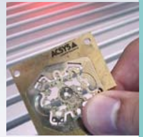
4. Das perfekte Ergebnis entnehmen und mit nächstem Projekt fortfahren.