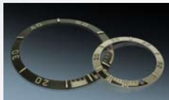
Laserbeschriftung von Taucherlunetten.