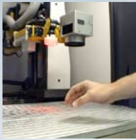
1. Zu bearbeitendes Teil einlegen.

Das Kameraeinrichtmodul LAS - Live Adjust System® auf einen Blick