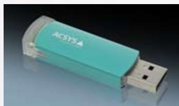
Laserbeschriftungen auf Werbeartikeln.